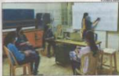
BACK ON CAMPUS: Students have been strictly instructed to follow SOPs in place for Covid-19 safety, including wearing masks, using hand sanitizers, temperature screening checks and social distancing

At Lady Dook College, final year UG students were allowed to attend classes on a voluntary basis with permission of their parents as the college is continuing with online classes as well. "There is strict effort to follow through online classes. However, for practical classes, we need facilities to con-