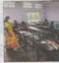
FEW IN NUMBERS: The number of students in engineering colleges was low on Monday

Similarly, the number of students at the engineering colleges was also low on Monday. College authorities said that the students from Anna Univer-