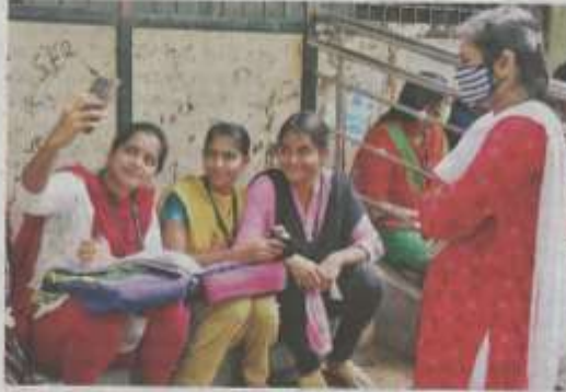
▲ முதல் நாளன்று தங்கள் நண்பர்களைச் சந்தித்து மிகவும் மகிழ்ந்த மதுரை கல்லூரி மாணவிகள்.

இந்நிலையில் இன்றைய தினம் ஆண்டு பட்டியல் மாணவர்களுக்கு நேற்று (டிச.7) முதல் கல்லூரிகளைத் திறக்க அரசு உத்தரவிட்டது. இதைப்பற்றி தமிழகம் முழுவதும் கலை, அறிவியல் கல்லூரிகள் நேற்று திறக்கப்பட்டன. மதுரையில்