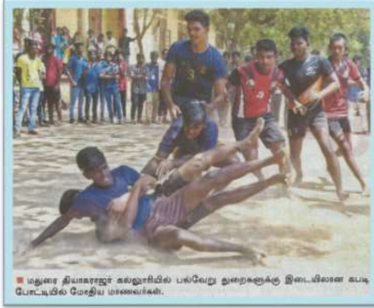
■ மதுரை தியாகராஜர் கல்லூரியில் பல்வேறு துறைகளுக்கு இடையிலான கடித போட்டியில் மேதிய மாணவர்கள்.