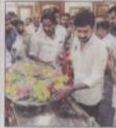
TEARFUL FAREWELL: State IT minister Palaniivel Thiagarajan and (right) sports minister Udhayanidhi Stalin pay tributes to Karumuttu T Kannan in Madurai on Tuesday