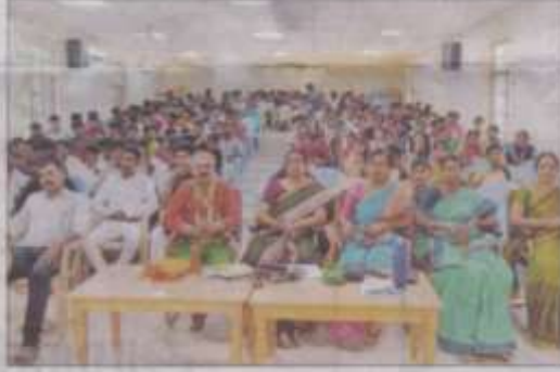
✦ மதுரை தியாகராசர் கல்லூரியில் நடைபெற்ற முத்தமிழ் மன்ற விழாவில் பங்கீகற்று போசீரியர்கள், மாணவ, மாணவிகள்.

முதலாம் ஆண்டு தீளங்களால் தமிழ் மாணவர்களின் நாடகம், ஆணவிக் கொற்பொழிவு உணர்விட்ட கலை நிகழ்ச்சிகள், பட்டிமன்றம் நடந்தன. முத்தமிழ் மன்ற நிர்வாகிகள் நேர்த்தெடுக்கப்பட்டனர்.