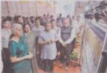
Union Finance Minister Nirmala Sitharaman at the photo exhibition in Madurai on Monday.