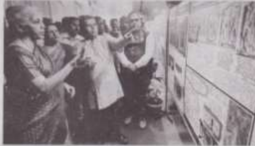
Union Finance Minister Nirmala Sitharaman inaugurated an exhibition on rock-cut temples in south Tamil Nadu in Madurai on Monday

"Each text found on rock cuts, the state's spirituality, language and literature are interconnected, just like the work