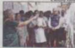
ON HERITAGE TRAIL: Union finance minister Nirmala Sitharaman at the photo exhibition arranged by the ASI in Thiagarajar College in Madurai

Nirmala Sitharaman said a Chola king had set up a medical facility during his reign and the stone inscriptions about it and the medicines administered there are found in a temple in Kanchipuram. The temples are a treasure trove of history and heritage, she said. She asked the students to visit the exhibition on rock-cut temples organized by ASI at the college and asked them to do small write-ups and publish them on their