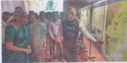
மதுரை தியாகராய் சுப்பிரமணியன் கலைமன்றம் தொடங்கிவைத்துப் பேசிய மத்திய நிதி அமைச்சர் நிர்மலா சீதாராமன்.

இந்திரா தலைமை ஏற்ற நட்சத்திர தி20 மாநாட்டில் உலகமே ஒரே குடும்பம் (வகைகள் குடும்ப