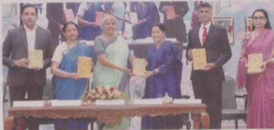
Union Finance Minister Nirmala Sitharaman launching a book at Thiagarajar College in Madurai on Sunday.