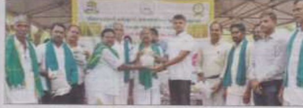
↑ மதுரை தியாகராசர் கல்லூரியில் நடந்த நெல் திருவிழாவில் விளையாட்டுக்கூட்டம் துவங்கியது. பாரம்பரிய நெல் விளையாட்டுகள் வழங்கப்பட்டன.