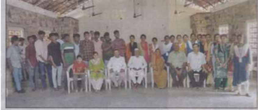
↑ காந்தி நினைவு அருங்காட்சியகத்தில் நடந்த கலாச்சார சந்திப்பு நிகழ்ச்சியில் கலந்து கொண்டவர்கள்.